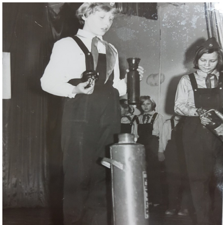
Изучение устройства огнетушителя в школе города Ульяновска

Потребовалось время, чтобы научить людей пользоваться новыми огнетушителями. Эта задача была успешно решена совместными действиями пожарной охраны и сотрудниками ВДПО.