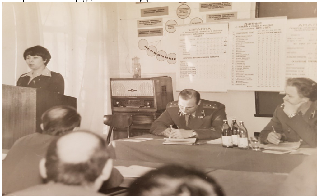
Областное совещание УПО УВД и ВДПО 1981 год.

Потребовалось время, чтобы научить людей пользоваться новыми огнетушителями. Эта задача была успешно решена совместными действиями пожарной охраны и сотрудниками ВДПО.