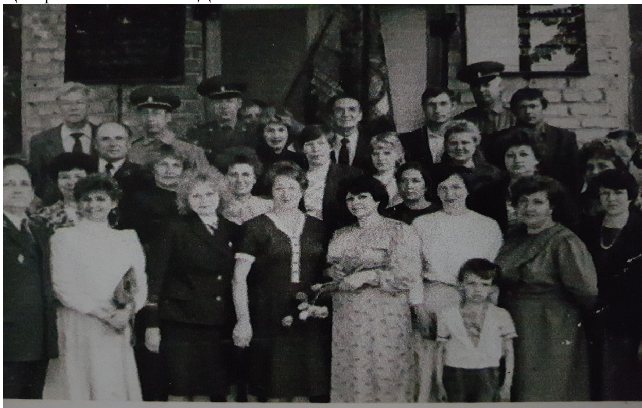
Вручение знамени Центрального Совета ВДПО Ульяновскому областному отделению ДПО 1988 год

Проделанная системная работа под его руководством позволила стабилизировать обстановку с пожарами в области. За хорошие показатели в работе Ульяновскому отделению ВДПО в 1988 году было вручено знамя Центрального Совета ВДПО.