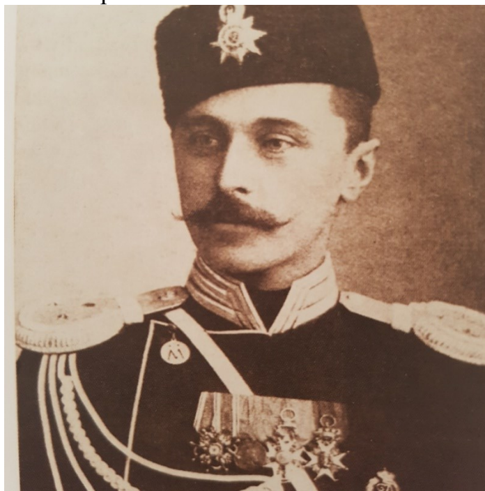
Граф Александр Дмитриевич Шереметев Основатель и первый Председатель совета Соединенного Российского Пожарного Общества.

Инициатива создания пожарного общества в России исходила от Императорского технического общества. Уставную комиссию возглавил граф Александр Дмитриевич Шереметев.