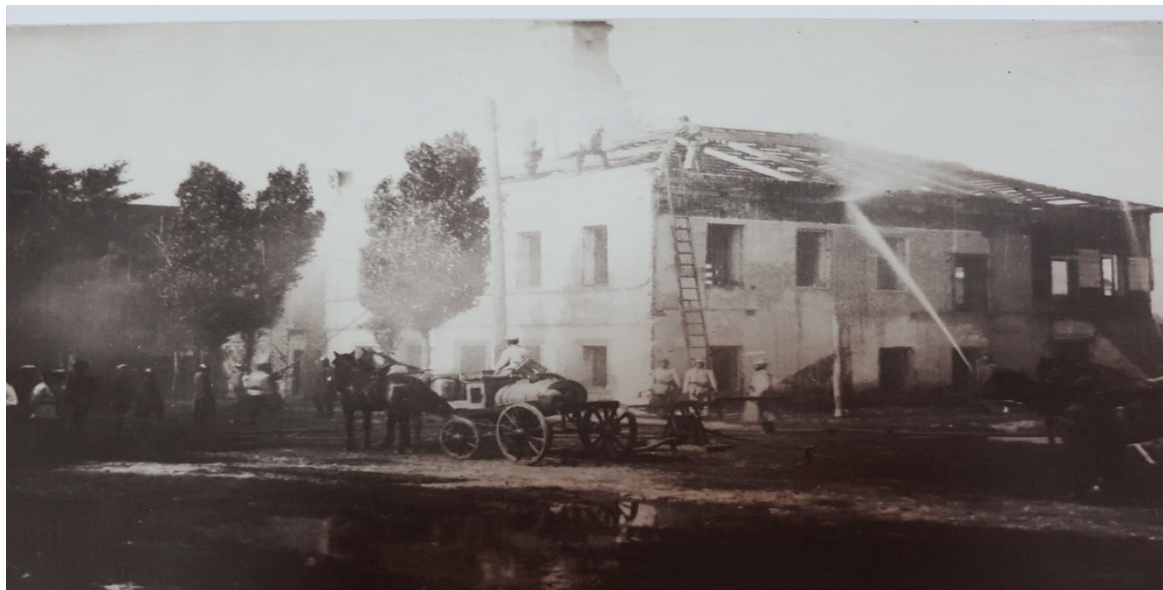
Добровольцы на учениях 1926 год

18 июля 1927 года ВЦИК и СНК РСФСР утвердили «Положение об органах государственного пожарного надзора». Этот день считается днем создания Государственного пожарного надзора в России.