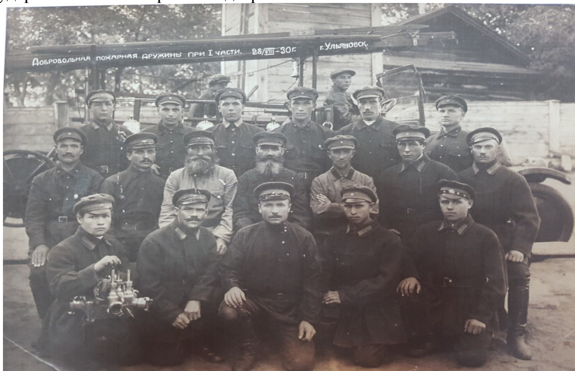
Добровольная пожарная дружина при 1 части города Ульяновска 1930 год.

18 июля 1927 года ВЦИК и СНК РСФСР утвердили «Положение об органах государственного пожарного надзора». Этот день считается днем создания Государственного пожарного надзора в России.