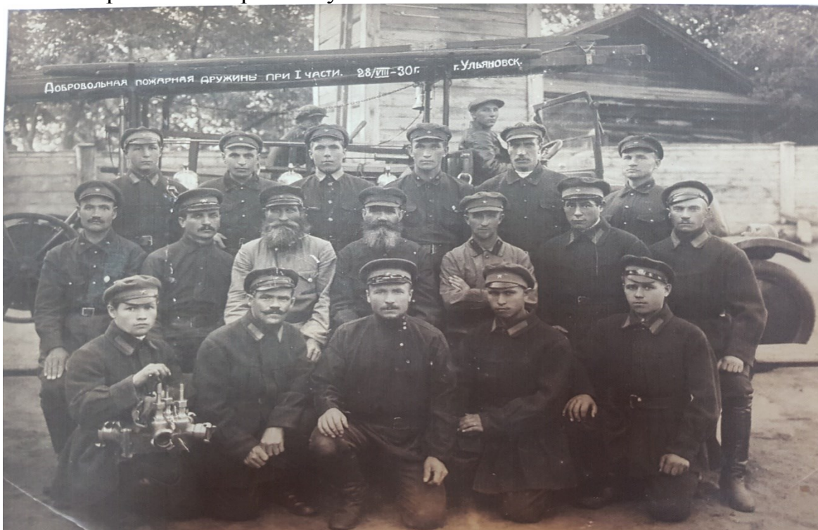
Добровольная пожарная дружина при I части города Ульяновска 1930 год.

С распадом Советского Союза в 1999 году президентом России Борисом Ельциным был подписан указ №539 от 30 апреля и этот день стали считать Днем пожарной охраны России. Эта дата выбрана не случайно, в этот день в 1649 году царь Алексей Михайлович Романов подписал указ о создании первой Российской противопожарной службы.